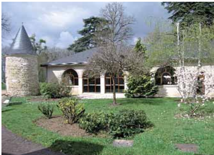
Le chateau du Courbat étend ses activités