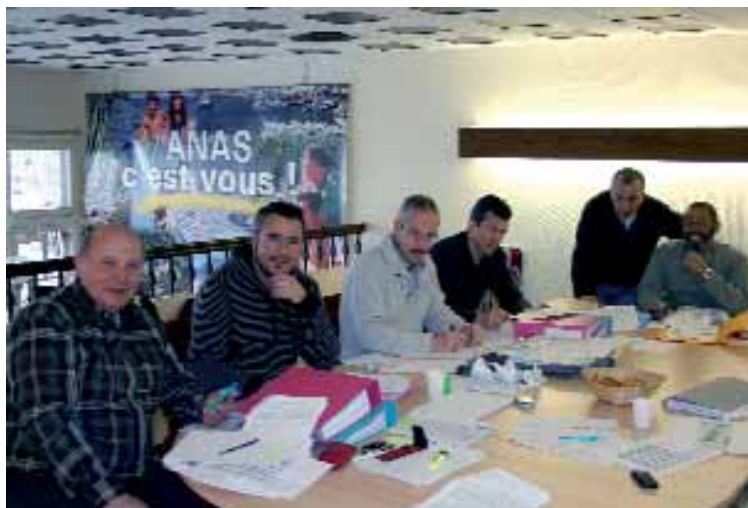
Ci-contre réunion de la Commission nationale de contrôle financier

Les nombreuses activités et partenariats de l'ANAS, depuis 12 mois, sont présentés dans cet "Écho du policier". Il est important de prendre connaissance de nos actions... car l'ANAS, c'est VOUS!