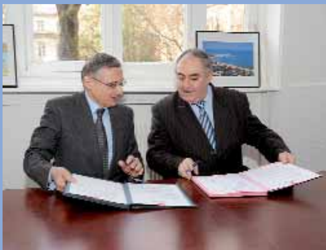
C'est un partenariat de communication qui a été passé entre l'ANAS et la Fondation Jean Moulin.

jeux en pleine nature, découverte de petits animaux, jeux sportifs, vélos, trottinettes.