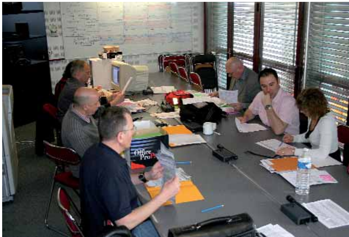
Ci-dessus, les membres de la Commission nationale d'attribution des centres de vacances ANAS réunis au siège de l'ANAS, à Joinville-le-Pont.

Une infrastructure de qualité est à votre disposition : salle de kinésithérapie, salle de relaxation, piscine couverte, terrains multisports, parcours de santé, sentiers pédestres dans la forêt.