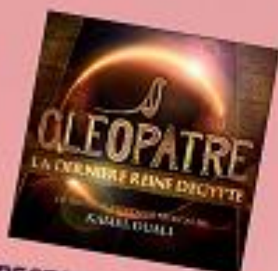
SPECTACLE CLEOPATRE KAMEL OUALI

Réservation du lundi au vendredi de 10h00 à 17h00